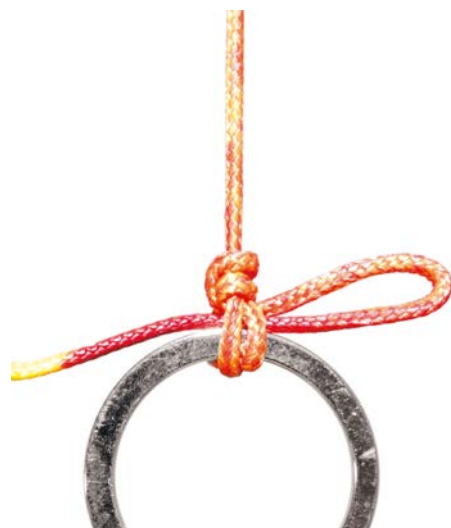
NOEUD STILSON GANSÉ