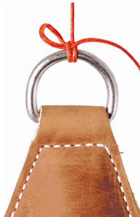
NOEUD CABESTAN GANSÉ